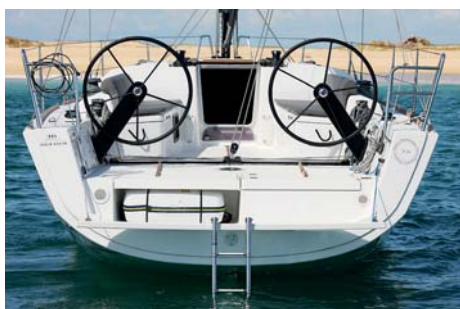
Prostor, kde je uložen záchranný ostrůvek, je dobře přístupný. Stačí odklopit koupací plošinu a zvednout sedačku kormidelníka.