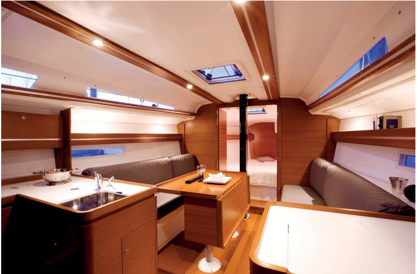
Moabi nábytek, dřevěné obložení a bílý Corian dodávají interiéru na útulnosti a přispívají k vytvoření příjemné atmosféry.

řena několika teakovými zarážkami jak pro kormidelníka, tak pro posádku, před kormidelními koly je na ní připevněna také kolejnice jezdce otěží hlavní plachty. Devítidesetinové