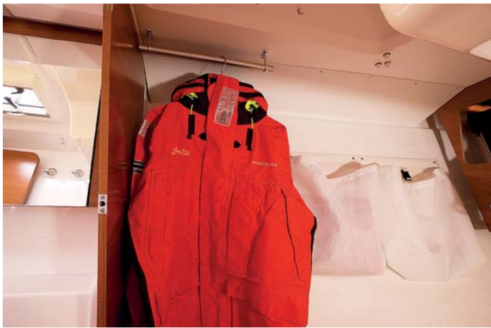
Nechybí místo na odkládání mokrého oblečení.