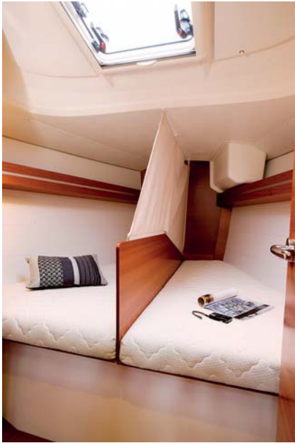
Lůžka v obou kajutách mohou být rozdělena do samostatných spacích kójí.