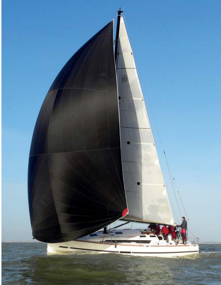
Devítidesetinové oplachtění tvoří poměrně vysoká hlavní plachta, 114% gena a genakr na vysouvacím karbonovém čelenu, vše značky Elvström Sails.

Tvar trupu s kolmou přídělí působí agresivně a společně s dlouhým T-kýlem je velmi efektivní.