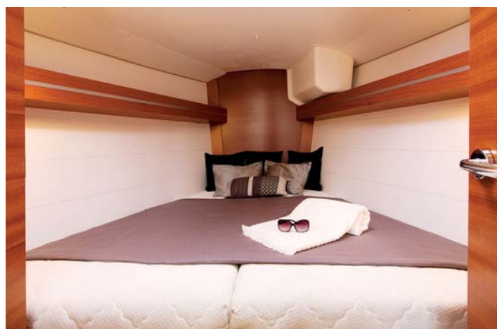
Kajuta v přídi je poměrně velká s dvojlůžkem do tvaru „V“.