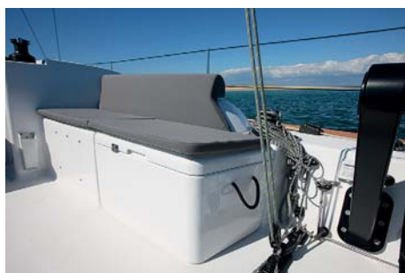
Sedáky i stůl lze odejmout, takže v kokpitu při plavbě nic zbytečně nepřekáží, což usnadňuje pohyb vícečlenné posádky.