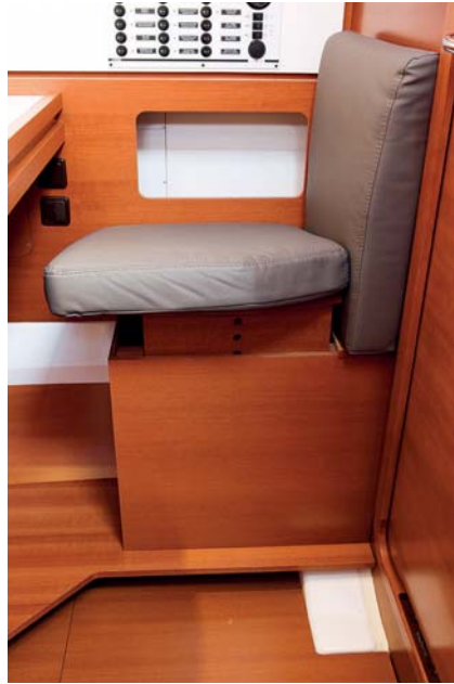
Sedačka navigátora je výškově nastavitelná.

Ve výbavě lodě najdete vše, co budete po celou dobu plavby potřebovat.