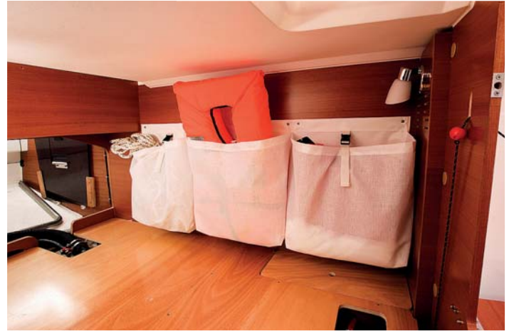
Praktické úložné prostory najdeme všude na lodi.