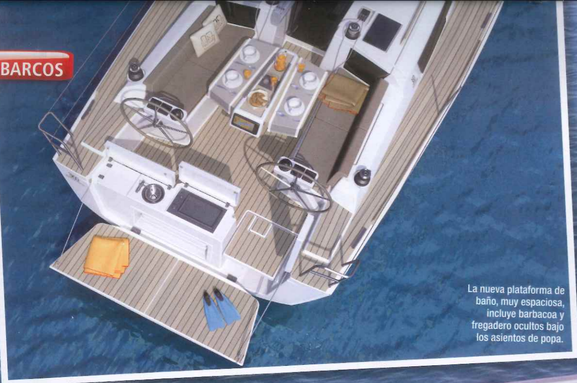
La nueva plataforma de baño, muy espaciosa, incluye barbacoa y fregadero ocultos bajo los asientos de popa.

El diseño del roof, con más superficies acristaladas, nueva tapa de reenvíos e inserto para la capota es una de las grandes novedades