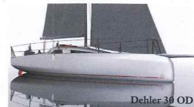
Dehler 30 OD

Le novità. Dehler 30 OD (Lungh. 10,22 m; largh. 3,25 m). www.dehler.it ; www.nautigamma.com